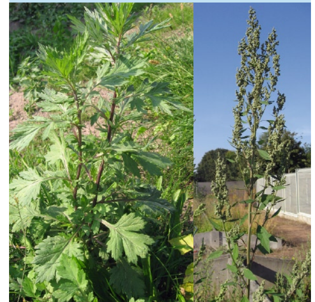
Links: Gemeiner Beifuß ( Artemisia vulgaris ) Rechts: Gänsefuß ( Chenopodium sp.)

Wegen ihrer unscheinbaren Blüten wird die Pflanze leicht übersehen. Sie kann mit anderen Arten verwechselt werden, z. B. mit dem Gemeinen Beifuß ( Artemisia vulgaris ), aber auch mit der Wilden Möhre ( Daucus carota ) und Gänsefuß-Arten ( Chenopodium sp.).