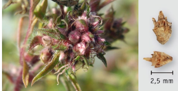
Früchte der Beifuß-Ambrosie