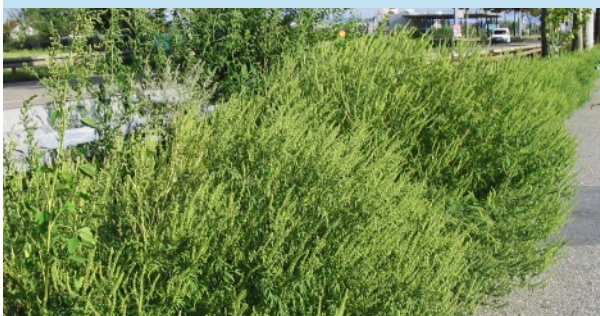
Größerer Bestand der Beifuß-Ambrosie an einer Bundesstraße bei Mannheim

Um der Ausbreitung der Pflanzen entgegen zu wirken, wird die Bevölkerung um Mithilfe gebeten.