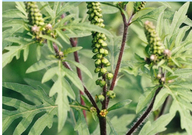
Beifuß-Ambrosie zu Beginn der Blüte mit deutlich rötlichen, behaarten Stängeln