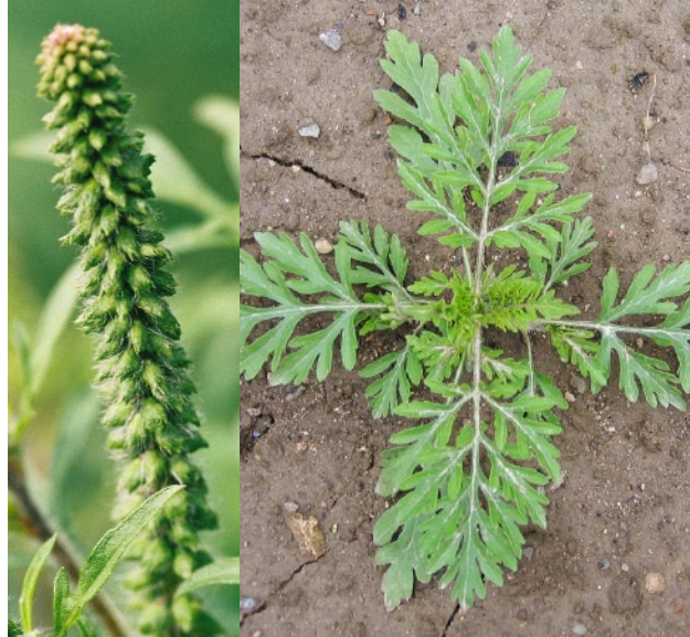
Männlicher Blütenstand der Beifuß-Ambrosie (links) Junge Pflanze mit typischen doppelt fiederteiligen Blättern (rechts)

Charakteristisch für die Beifuß-Ambrosie sind