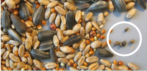
Mit Ambrosia-Samen verunreinigtes Vogelfutter