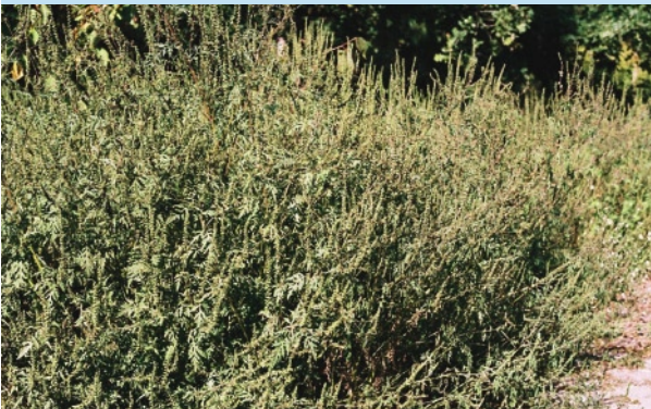
Größerer Bestand blühender Beifuß-Ambrosien

Die Pflanze wächst vorzugsweise auf gestörten offenen Böden, z. B. an Straßenrändern, in Neubaugebieten oder auf Schutthalden. In privaten Gärten findet man sie vor allem unter Vogelfutterplätzen, denn Vogelfutter kann mit Ambrosia-Samen verunreinigt sein.